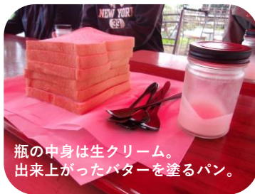
瓶の中身は生クリーム。出来上がったバターを塗るパン。