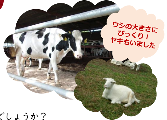
ウシの大きさにびっくり！ヤギもいました