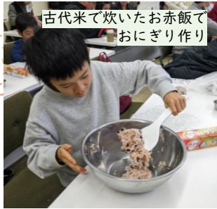
古代米で炊いたお赤飯でおにぎり作り