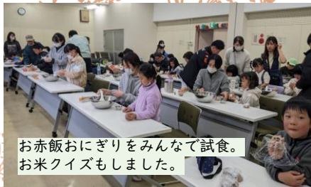
お赤飯おにぎりをみんなで試食。お米クイズもしました。

締めくくりの言葉は「農家のみなさんが苦勞して作られたお米や野菜を、みなさんたくさん食べてください」でした。体験を通して学んだことや感謝の気持ちを忘れずに、お米や野菜をいっぱい食べましょう!