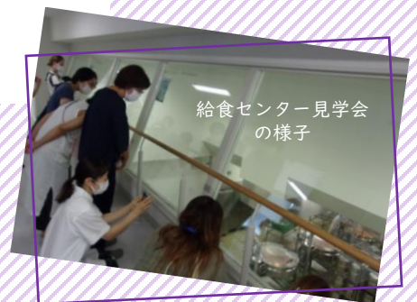
給食センター見学会の様子