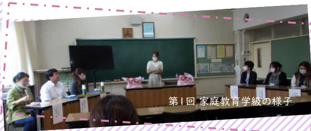
第1回 家庭教育学級の様子

子育てに悩みはつきもの。家庭教育学級では、そんな悩みが少しでも軽くなるようなお話が聞けたりするよ！見学会や体験会では、保護者のみなさんとの交流も楽しめます。