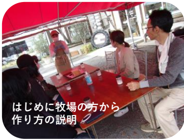
はじめに牧場の方から作り方の説明