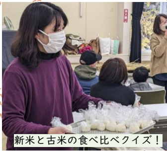
新米と古米の食べ比べクイズ!